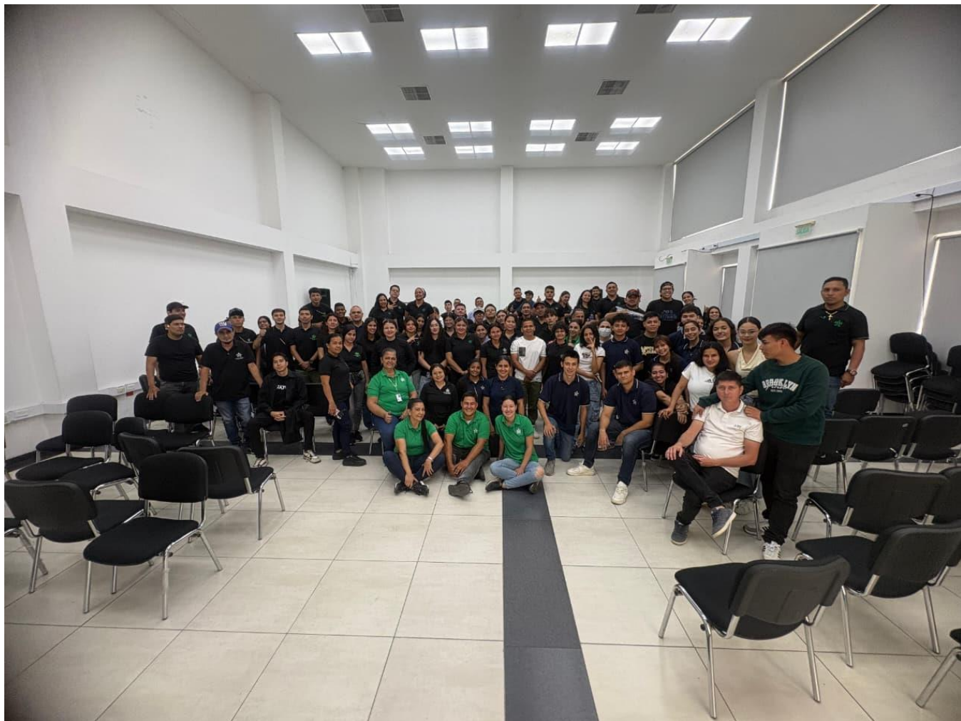
Ilustración 4: Se realizó apoyo correspondiente en la brigada de salud en Pescadero.

Obligación 3: Participar y proponer estrategias orientadas a la formulación del plan de bienestar al aprendiz del Centro de Formación según normatividad vigente.