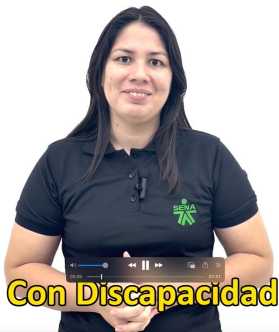
Ilustración 11 : Se realizó piezas gráficas de apoyo para las actividades de Bienestar.