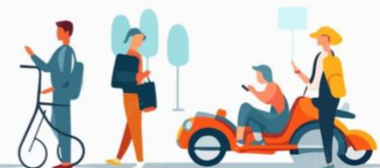
Ilustración 9 : Se realizó piezas gráficas de apoyo para las actividades de Bienestar.