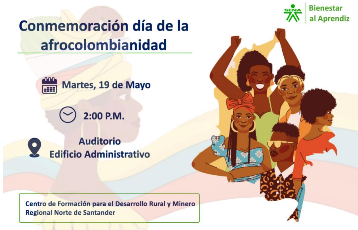
Ilustración 8 : Se realizó piezas gráficas de apoyo para las actividades de Bienestar.

Obligación 5: Hacer uso adecuado y responsable de los elementos y materiales a cargo para la ejecución de sus actividades contractuales.