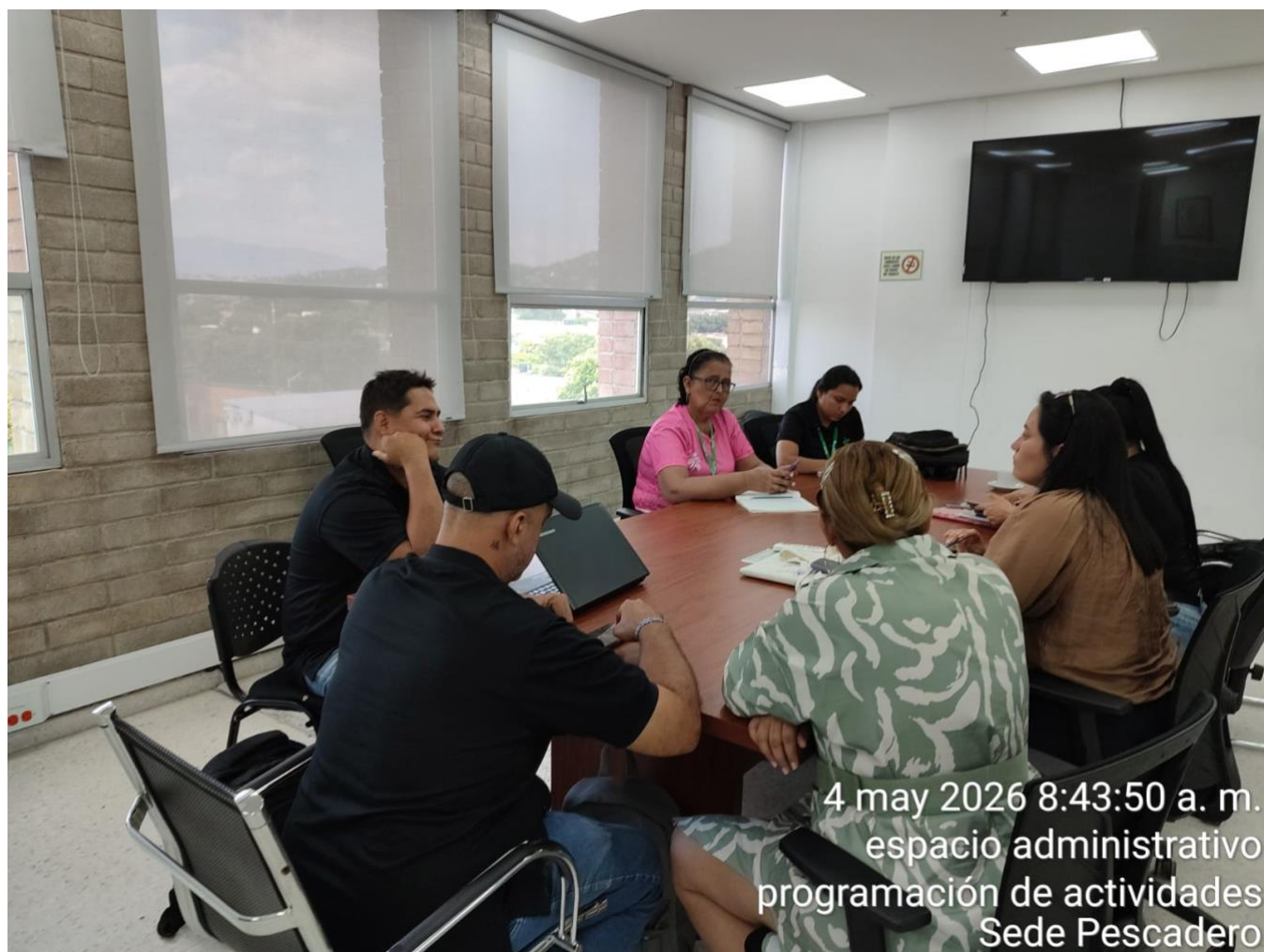
Ilustración 1: Se presentó informe solicitado por la líder de bienestar para evaluar el plan de trabajo.

Obligación 1: Presentar para aprobación por parte de supervisor de contrato, un plan de trabajo que incluya cronograma y entregables.