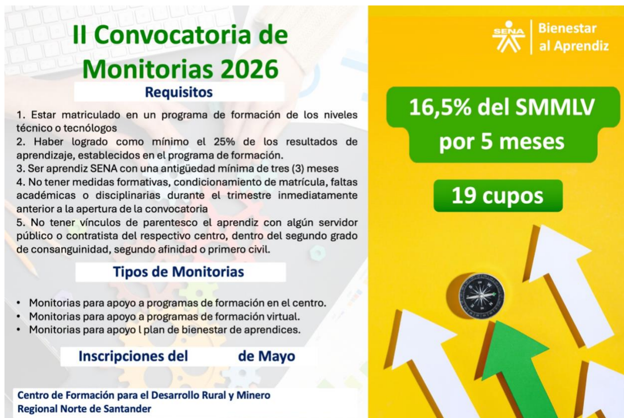
Ilustración 10 : Se realizó piezas gráficas de apoyo para las actividades de Bienestar.