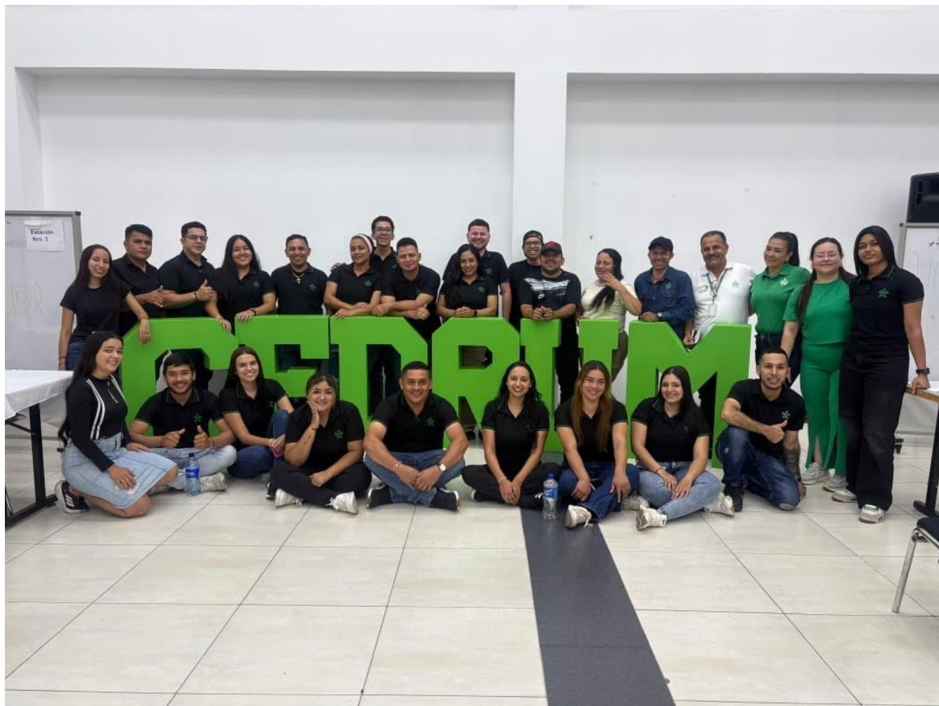
Ilustración 6: Se realizó apoyo correspondiente en la brigada de salud en Pescadero