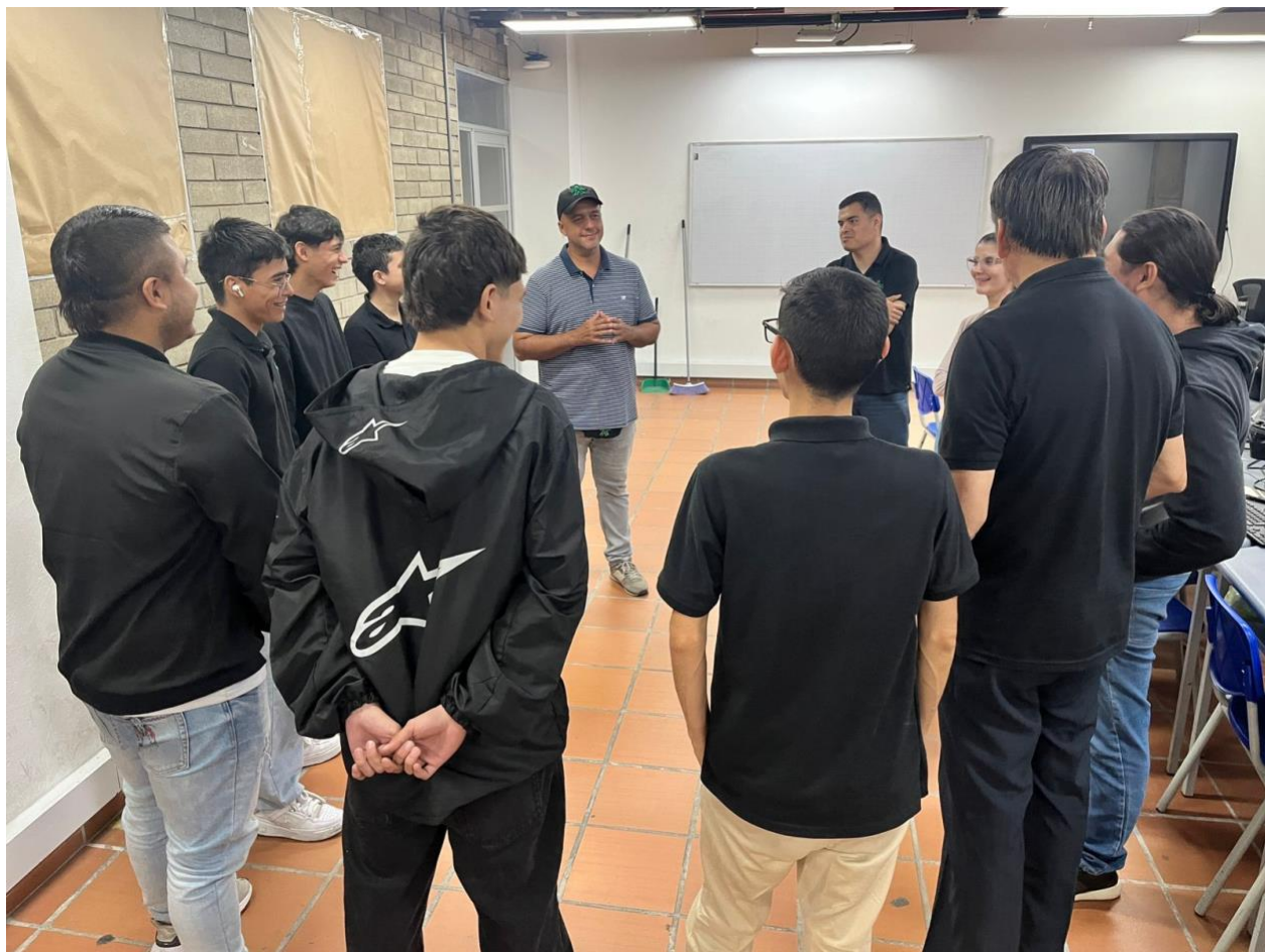
Ilustración 13 : Se realizaron actividades en las formaciones programadas.

Obligación 7: Desarrollar las actividades del objeto contractual en las diferentes modalidades de formación, (presencial, virtual y/o a distancia) que aplique para el centro de formación.