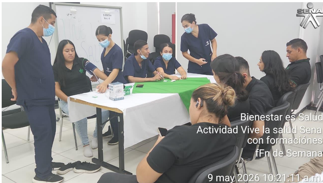
Ilustración 5: Se realizó apoyo correspondiente en la brigada de salud en Pescadero.